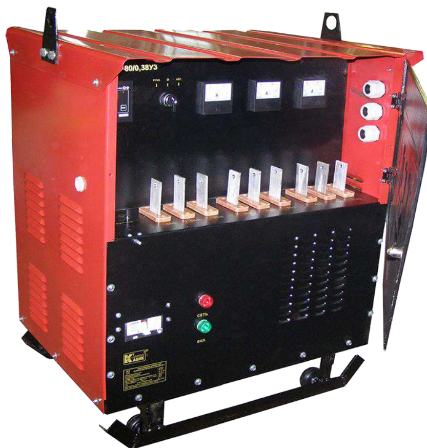
Рис.1 Общий вид трансформатора

1.6. Изделие предназначено для подключения только к промышленным сетям. Подключение к сетям бытовых помещений не допускается.